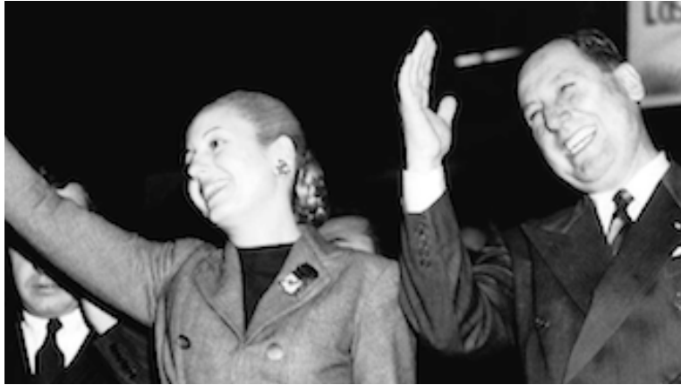
Juan y Eva Perón