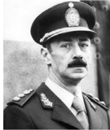
Jorge Rafael Videla