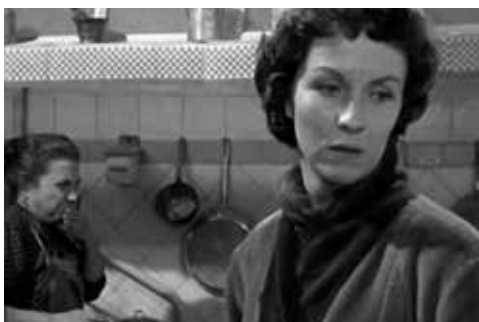
Calle mayor (1956)

Muestran la amargura de las solteras. Diego Galán considera que estas películas son las más profundas que se han hecho en España sobre la represión social o religiosa recibida por las mujeres en ciudades de provincias.