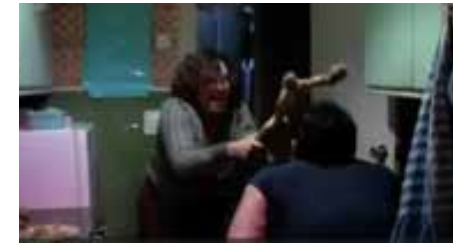
¿Qué he hecho yo para merecer esto ? 1984