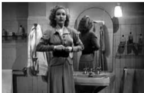
La vida empieza a medianoche (1943)

Contraste entre el pasado y el presente como por ejemplo :