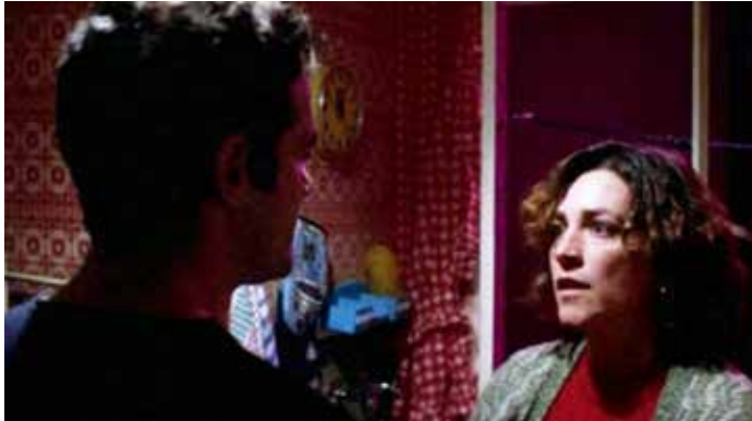
¿Qué he hecho yo para merecer esto ? (1984)