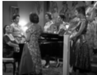
Los maridos no cenan en casa 1956