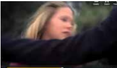
Sábado, Chica y motel 1976