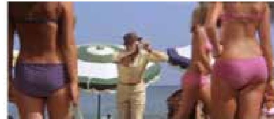
Objetivo Bikini 1968