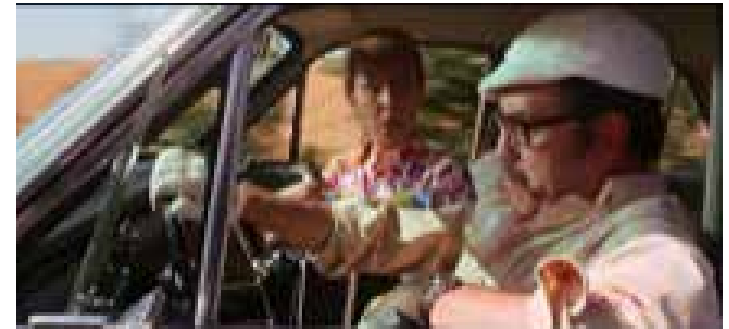
Objetivo Bikini (1968)