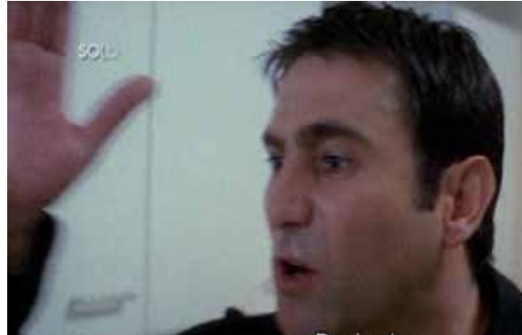
Solo mía (2001) ("Soy tu marido, respétame")