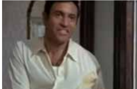
Como sois las mujeres (1968)