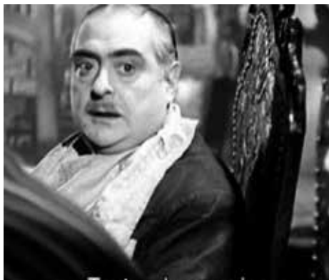
Tuvo la culpa adán (1943)

Los Olmedo son una familia de varones misóginos que han jurado odio eterno a la mujer, desde que una de ellas dejó plantado a uno de los miembros de la familia en la puerta de la iglesia