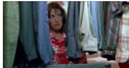
Mujeres al borde de un ataque de nervios 1987