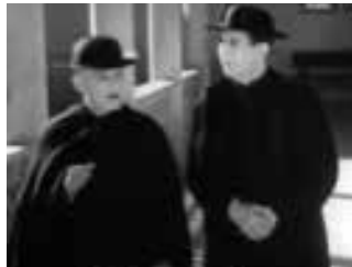
El agua en el suelo 1934