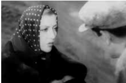
¡Centinela alerta! (1937)