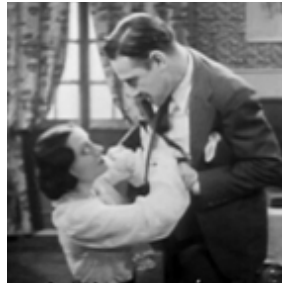
Don Quintín, el amargao (1951)

Estas fotos son extractos de melodramas de aquella época. Busca en internet el sinopsis de la película y describe las fotos. ¿Qué muestran? Describir ¿Representan una imagen de mujer liberada?