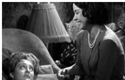
La tía Tula (1964)