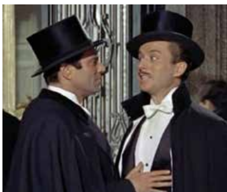
La Violetera (1956)