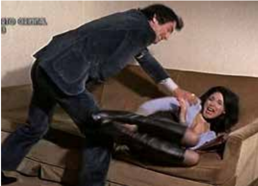
Aborto criminal (1973)