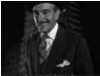
El batallón de las sombras 1957

El trailer presenta varios extractos de películas. He aquí algunas fotos sacadas de estas películas :