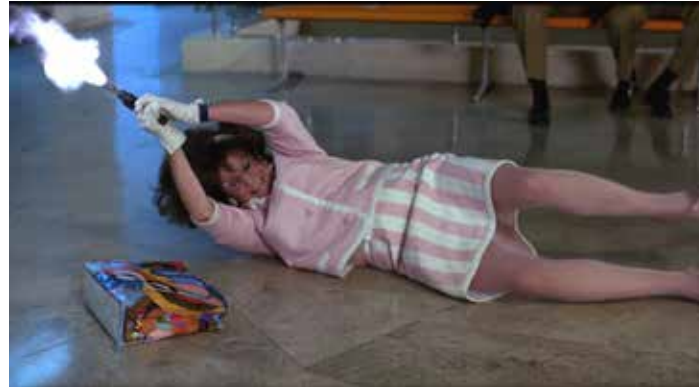
Mujeres al borde de un ataque de nervios (1988)

Son dos escenas de películas de Pedro Almodóvar.