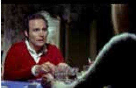
Las secretarias (1969)