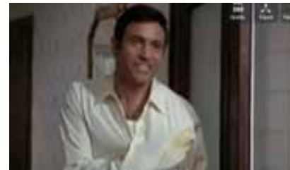
Como sois las mujeres 1968