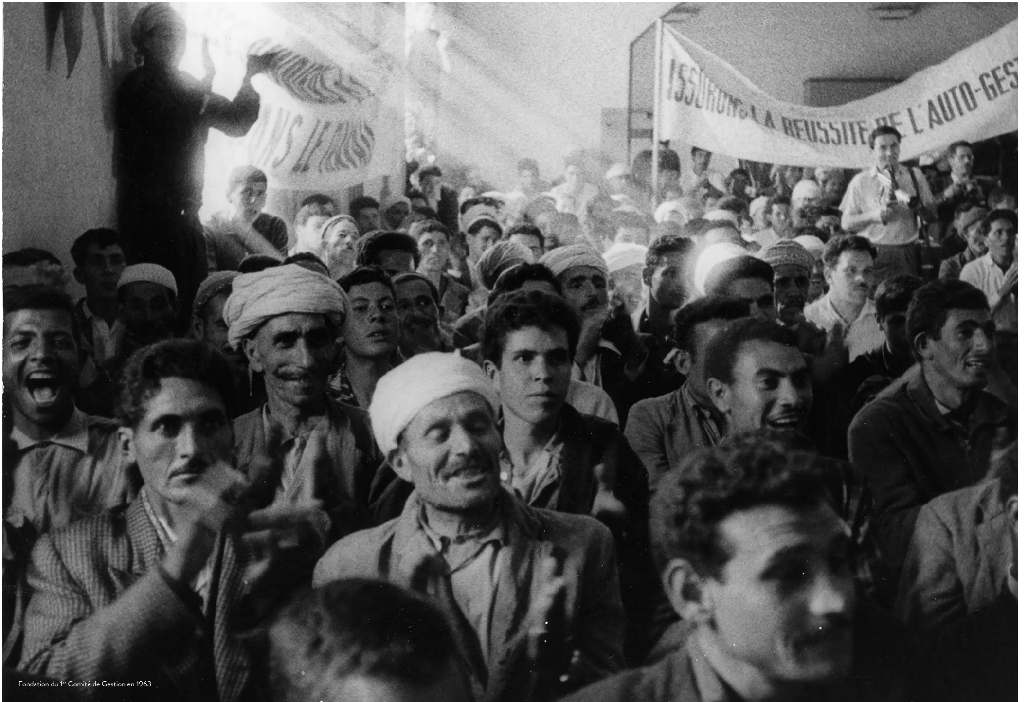
Fondation du 1 er Comité de Gestion en 1963