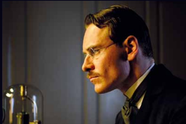
Michael Fassbender - Carl Gustav Jung

«Ce qui donne toute sa valeur à A DANGEROUS METHOD , c'est que le film nous restitue une tranche de vie de ces gens célèbres dont nous ignorons presque tout. Le film reste très accessible dans la mesure où l'on découvre qu'ils ne sont que des êtres humains, réagissant comme nous tous. Ils ont les mêmes désirs et les mêmes jalousies. C'étaient des gens très brillants, qui avaient nécessairement des problèmes d'ego. C'est intéressant de les voir réagir quand ils se sentent piégés et comment ils agissent sur leur entourage, parfois le plus proche.»