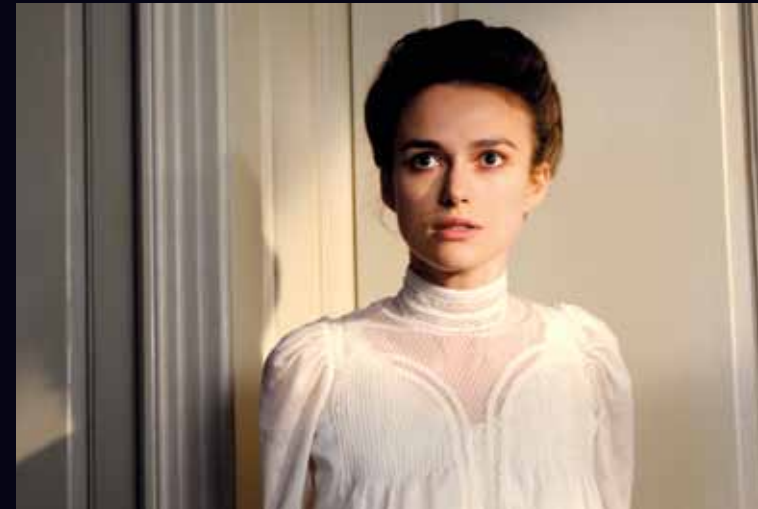
Keira Knightley - Sabina Spielrein

Après avoir lu le scénario, elle se mit immédiatement à étudier le monde de la psychanalyse, compilant énormément de livres et d'articles sur le sujet, ainsi que toutes les informations qu'elle put trouver à propos de Sabina.