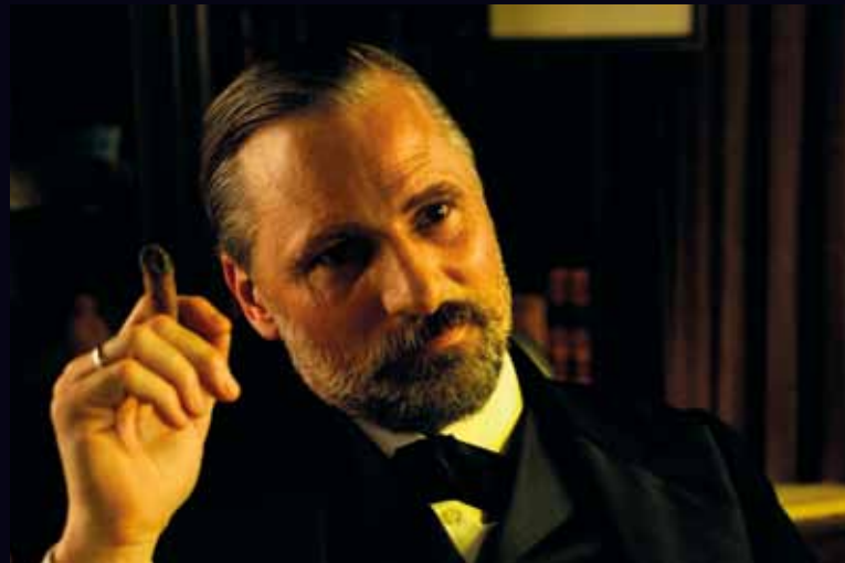
Viggo Mortensen - Sigmund Freud

Fidèle à sa «méthode», Mortensen s'est totalement immergé dans l'étude de Freud, composant son personnage avec sa minutie coutumière : il a été jusqu'à faire un pèlerinage dans sa demeure natale, dans ses appartements de Vienne et de Londres, il a visité le Burghölzli, a lu la plupart de ses livres, a étudié les photos et les bandes d'actualités et a même été jusqu'à retrouver la marque des cigares qu'il fumait.