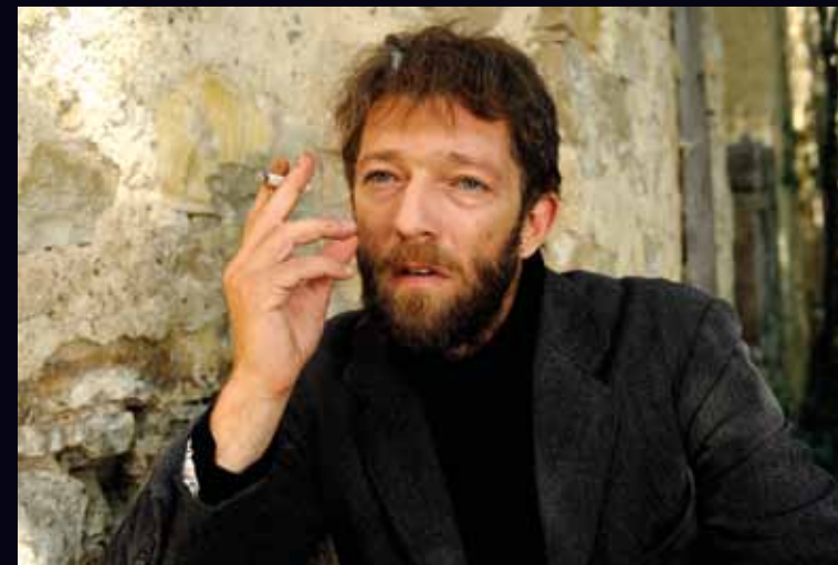
Otto Gross - Vincent Cassel

Après LES PROMESSES DE L'OMBRE , Vincent Cassel a sauté sur l'occasion de pouvoir travailler de nouveau avec Cronenberg.